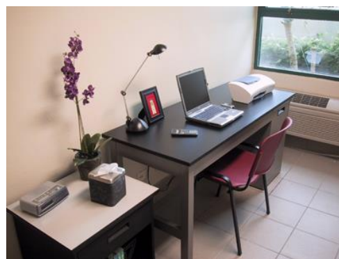
Escritorio en habitación