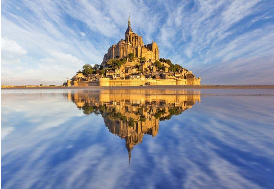
Mont Saint-Michel, costa norte de Francia

Autorización para tomar Cursos en Otras Instituciones