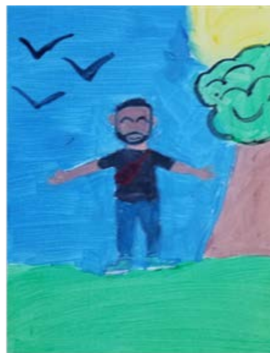
Trabajos realizados por los participantes durante la sesión de Arte Terapia.